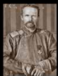
Р. фон Унгерн